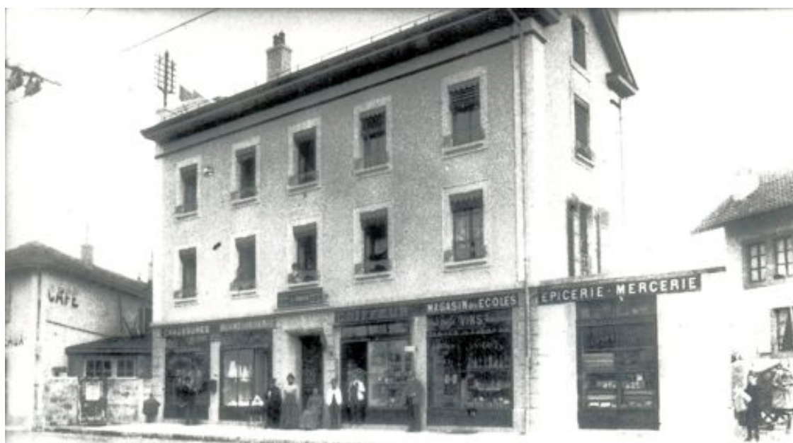
Petit-Lancy, Maison Berthoud

Sur la place du village, il y avait une dame qui vendait des bonbons, un coiffeur, une marchande de légumes et la mercerie Mermillod. On traversait la rue et il y avait une épicerie, un boucher, un pharmacien, une laiterie, la Coop, un boucher et un charcutier séparés. Mais on ne mangeait pas de la viande tous les jours, ce n'était pas courant.