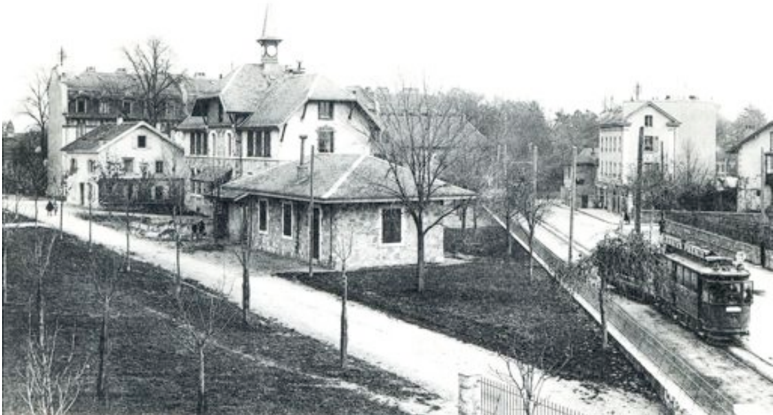
Première école primaire du Petit-Lancy

Nous allions à l'école toute la semaine, même le samedi, sauf le jeudi et le dimanche. C'était de 8h à 11h et de 13h30 à 16h. Nous étions 20-25 en classe. En primaire, les classes étaient mixtes. Ensuite, pour la suite, c'était séparé. Je me souviens de quand j'étais toute petite avec un garçon de mon voisinage, on était sous les fenêtres de la classe et on s'amusait avec des cailloux et la maîtresse nous surveillait. Puis, quand c'était 11h et que tout le monde partait, on partait aussi. C'était beaucoup plus libre que maintenant. Pour aller à l'école secondaire, qui était en ville, je prenais le tram avec une amie.