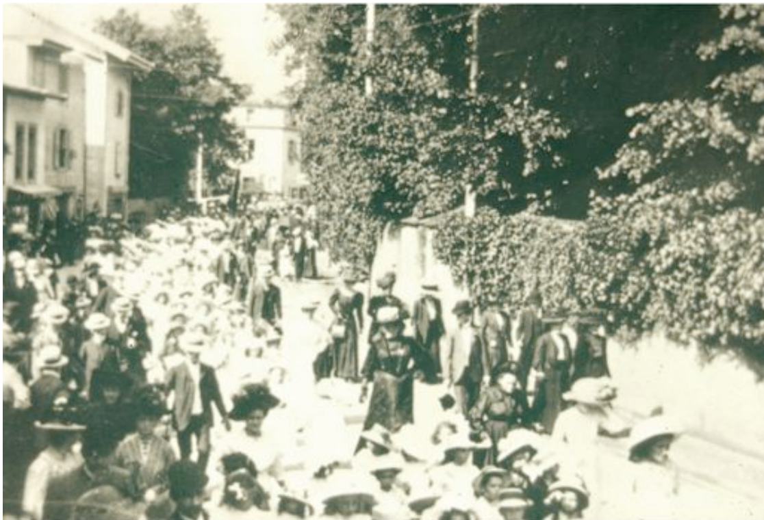
Les Promotions au Grand-Lancy

Il y avait aussi les promotions, quand tous les enfants défilaient à la rue.